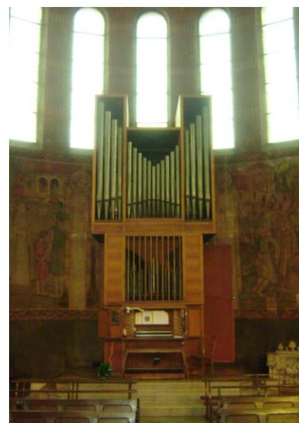
L'ancien orgue Benoit-Sarelot de 1974

Néanmoins, une grande partie de son matériel méritait d'être conservé, dont les trois sommiers et une grande partie de la mécanique et des tuyaux, certains probablement déjà récupérés de l'orgue du 19 e siècle présent dans l'ancienne église.