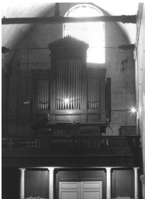
L'orgue du 19 e siècle, en tribune avant la reconstruction de la cathédrale.